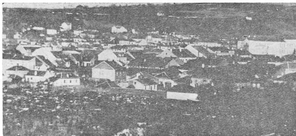
Један део старог Алексинца